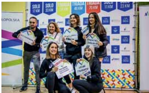
PIĄTEK. Biuro Zawodów