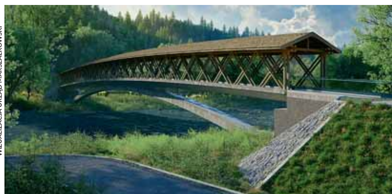
WIZUALIZACJA URZĄD MARSZAŁKOWSKI