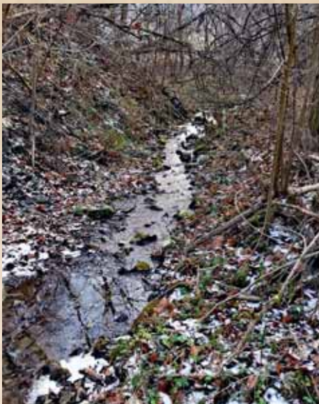
W dawnym królestwie boginek...

Boginkami stawać się miały samobójczynie, kobiety zmarłe podczas porodu, jak też morderczynie dzieci... W ludowych wyobrażeniach, mocnych zwłaszcza w regionie Pienin, były to istoty wysokie, chude, z wielkimi głowami i czarnymi jak węgiel włosami oraz długimi, obwisłymi piersiami... Wierzono, że zamieszkiwały zarośnięte jary i wąskie doliny górskich potoków. Miały być wielkimi miłośniczkami zielonego groszku, które kradły okolicznym gospodarzom, zaś szczególnie zagrażały młodym matkom, będącymi jeszcze w połogu... Boginki miały bowiem na celu ich porwanie, a następnie dręczenie, bezlitosne szydzenie i łaskotanie do granic wytrzymałości, co czasami prowadzić mogło nawet do śmierci. Szczególnie jednak chętnie podmieniały