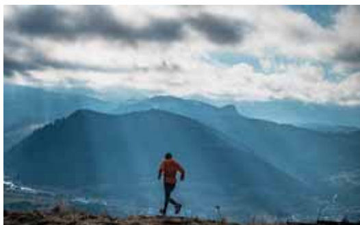
NIEDZIELA. Etap Beskid Sądecki