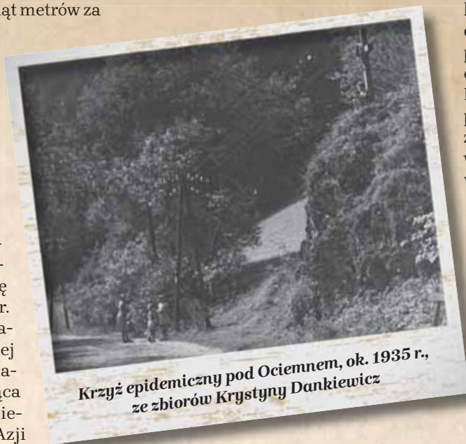
Krzyż epidemiczny pod Ociemnem, ok. 1935 r., ze zbiorów Krystyny Dankiewicz

zaś sama choroba występowała w dwóch odmianach: dymienicznej (powiększenie i pęknięcie węzłów chłonnych) i płucnej (największa śmiertelność).