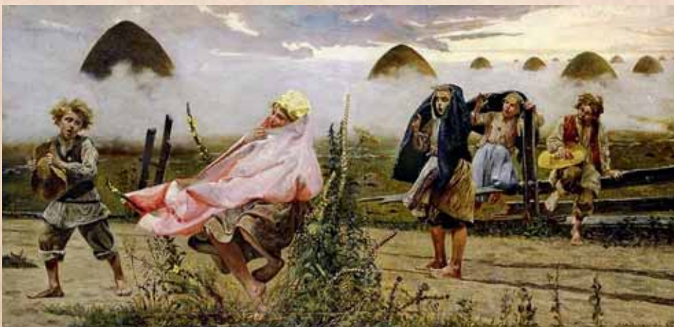
Jacek Malczewski, Boginka w dziewannach, obraz z cyklu Rusałki, 1888; Muzeum UJ, Kraków