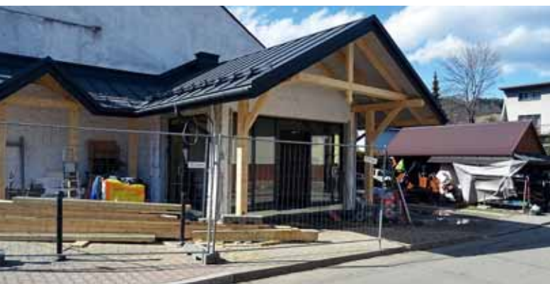
ZDJĘCIA: BEATA SZKARADZIŃSKA