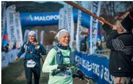
NIEDZIELA. Etap Beskid Sądecki

Ponad 400 biegaczy wzięło udział w Małopolskiej Etapowej Triadzie w Krościenku nad Dunajcem. Zmagali się oni na górskich trasach w pierwszy weekend stycznia. Partnerem tytularnym przedsięwzięcia była Małopolska, a współorganizatorem Centrum Kultury i Promocji w Krościenku nad Dunajcem.