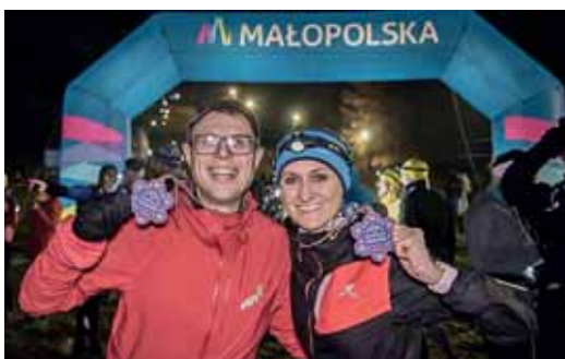
SOBOTA. Etap nocny