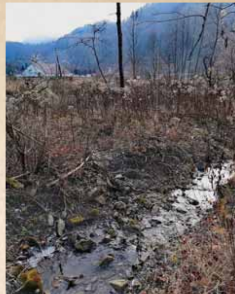
Potok Ścigocki (Stodółczany)

swoje szkaradne, wstrętne i złośliwe dzieci. Przed ich atakiem podobno skutecznie chronił kwiat dziurawca, którego mocy panicznie bały się te demoniczne istoty. Rygorystycznej ochronie przez członków najbliższej rodziny podlegały młode matki, które przez wiele dni w czasie połogu nie mogły wychodzić na zewnątrz chaty... boginki odstraszał także kolor czerwony. Zamianą dzieci przez boginki tłumaczono dawniej wrodzone choroby dzieci, wady rozwojowe, czy też niepełnosprawność, zaś depresję poporodową czy tzw. smutek poporodowy (baby blues) u młodych kobiet - ich krótkotrwałym uprowadzeniem przez te lesne złowrogie istoty.