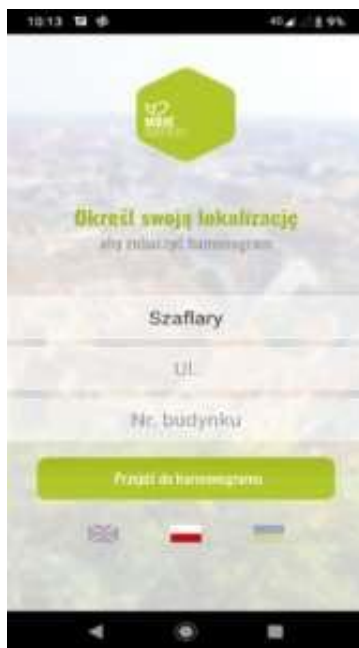
Główny widok aplikacji