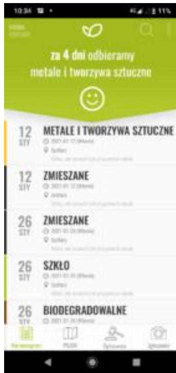
Widok zakładki Harmonogram