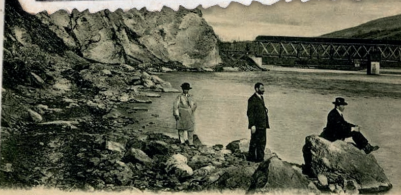
Koryto most między Krościenkiem a Szczawnicą

przedsiębiorstwo już nie działało, a kamień był brany niejako spontanicznie i bez jakiegokolwiek