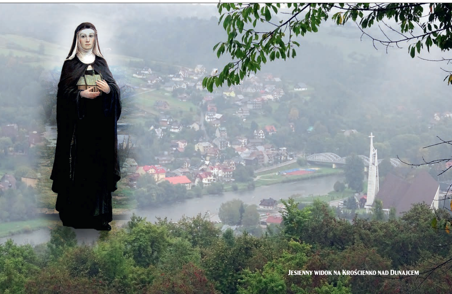
JESIENNY WIDOK NA KROŚCIENKO NAD DUNAJCEM